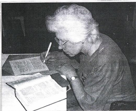
V HRADIŠTI SE PŘEPISUJE BIBLE. - Naše město se v minulém týdnu zapojilo do originálního projektu Ručně psaná Bible v jubilejním roce 2000. V Uherském Hradišti se budou jednotlivě úseky knihy knih přepisovat až do 14. května, denně od 8 do 18. o víkendech od 9 do 18 hod. -cuh-

Na přelomu tisíciletí jsme se mohli i v Uherském Hradišti připojit k projektu ručně psané Bible. V knihkupectví Portál na Masarykově náměstí jsem akci zahájil dvěma verši z Hesel Jednoty bratrské. „ Jsi přece svatý lid Hospodina, svého Boha; tebe si Hospodin, tvůj Bůh, vyvolil ze všech lidských pokolení, která jsou na tváři země, abys byl jeho lidem, zvláštním vlastnictvím. “ Dt 7,6. A také „ Ne vy jste vyvolili mne, ale já jsem vyvolil vás a ustanovil jsem vás, abyste šli a nesli ovoce a vaše ovoce, aby zůstalo; a Otec vám dá, oč byste prosili v jeho jménu. “ J 15,16